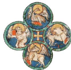
Formulare der Gottesdienste

† Es segne euch der allmächtige Gott, der Vater und der Sohn und der Heilige Geist. A. Amen.